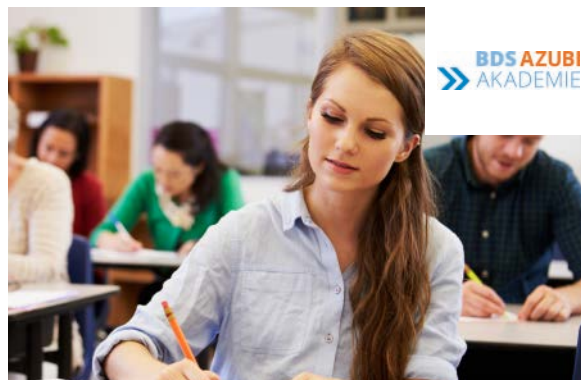
BDS AZUBIAKADEMIE: Lokales Netzwerk mit Mehrwert.

Die BDS AKADEMIE steht noch in den Startlöchern. Die Idee dabei ist, aus Mitarbeitern Führungskräfte zu machen, um im Betrieb auch einen „zweiten Mann“ oder eine „zweite Frau“ aufzubauen. Geplant sind Lehrgänge nach deren Akademisierung man mit einer fachlichen Berufsausbildung zum Bachelor oder Master aufsteigen kann. Ein absolut exklusives Konzept, das so nur der BDS bieten kann.